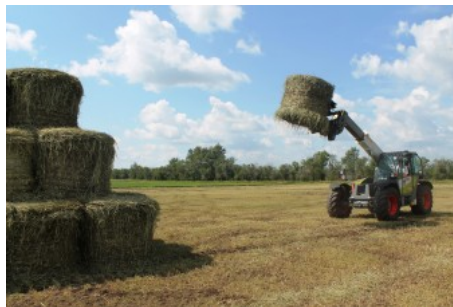
Телескопический погрузчик от фирмы Claas

О масштабы проведенного мероприятия можно было судить хотя бы по тому, что среди гостей на поле можно было встретить высокопоставленных лиц из Германии и представителей Украины. Поскольку это уже четвертый по счёту совместный с немецкой стороной День поля, это означает, что рынок нашей страны привлекает зарубежных поставщиков. То, чем Казахстан так перспективен для Германии, представитель из Министерства продовольствия и сельского хозяйства Германии Клаус Супп объяснил нераскрытым сельскохозяйственным потенциалом наших земель, ценность которых тем выше, чем больше возрастает мировая потребность в продовольствии, связанная с ростом числа населения планеты.