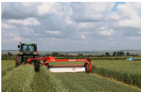
Косилка от фирмы Kuhn

зерноуборочных комбайнов и 2205 единиц тракторов.