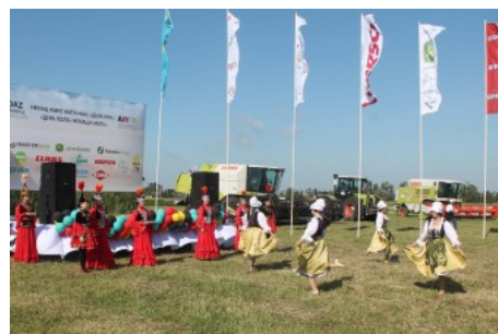
Единение двух культур