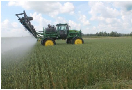
Опрыскиватель от фирмы John Deere