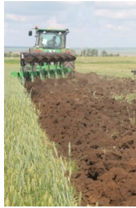
Оборотный плуг от фирмы John Deere

свои возможности. Почвообработка, кормозаготовка, опрыскивание посевов, уборка – всё это можно было не только увидеть своими глазами, но и испытать практически, сев в кабину понравившегося средства. Специалисты крупнейших фирм познакомили гостей Дня поля с техническими характеристиками машин.