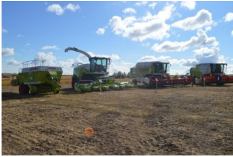
Под тяжелыми тучами на поле красовался ряд мощных моделей техники «CLAAS»

техники «CLAAS»: зерноуборочный комбайн TUCANO 440 с новой шнеко-вой жаткой CERIO 930, кор-моуборочные комбайны JAGU-AR 870 и 830, которые являются лидерами мировых продаж в своем сегменте, широкий модельный ряд тракторов: AXION 850 в тандеме с передне-навесной косилкой DISCO 3100 и задненавесной косилкой DISCO 8400. ARION 540 с валко-укладчиком LINER 1650 TWIN, ARION 630 с рулонным пресс-подборщиком ROLLANT 350 RC. Своеобразной изюминкой программы, вокруг которой собралось большинство представителей аграрной сферы, стали трактор XERION 4500 с разворотной кабиной и телескопические погрузчики. Представители компании старались показать многофункциональность погрузчиков SCOR-PION, при показе использовались огромное количество рабочих насадок, начиная от классических вил для тюков и лопат для сыпучих материалов, заканчивая