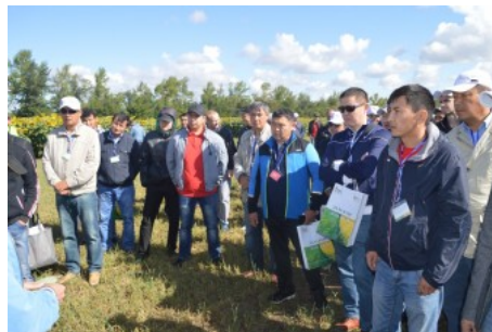
Чаглинский праздник отличился большим количеством присутствующих фермеров

Но всех удивил другой факт. Оказывается, делянки, на которых выращивали рапс, в этом году обрабатывали химией от вредителей 10 раз, это не стали скрывать и показали лист растения, частично съеденный капустной молью.