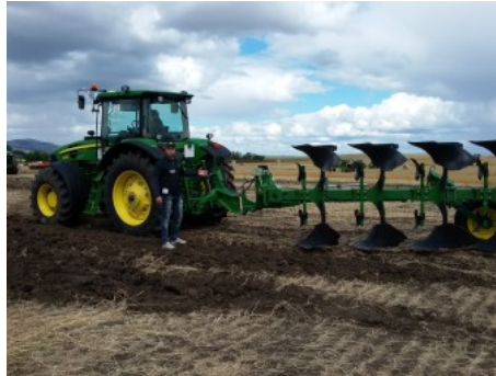
В Чаглинке Джон Дир блеснули во всей своей красе

Внимание большого количества глаз привлекли «Джон Дир». Компания «Джон Дир» обладает огромными производственными мощностями и имеет промышленную инфраструктуру в Северной и Южной Америке, Европе, Азии и Австралии. «Джон Дир» предлагает полный спектр сельскохозяйственной техники: тракторы, зерноуборочные, хлопкоуборочные комбайны и комбайны для уборки сахарного тростника, почвообрабатывающее, посевное оборудование, опрыскиватели, кормозаготовительную технику, интегрированные технологии по управлению сельскохозяйственным бизнесом.