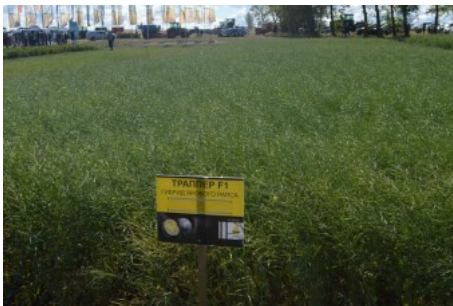
Гибрид рапса с высокой потенциальной урожайностью